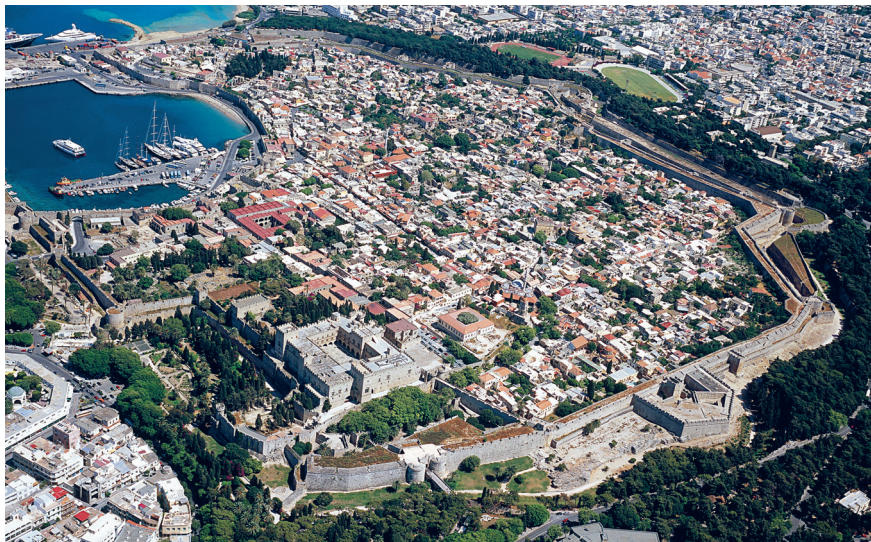
1. Γενική άποψη της τειχισμένης πόλης της Ρόδου.

κών στρατοπέδων που προσαρμόστηκε απόλυτα στον προϋπάρχοντα — «ιπποδάμειο» — πολεοδομικό ιστό (Μανούσου-Ντέλλα 2000).