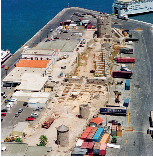
7. Άποψη του λιμανιού της πόλης της Ρόδου με τον μώλο των Μύλων.

Παρόλο που είναι σίγουρο ότι η εξαφάνιση τριών τόσο δυναμικών στοιχείων των οχυρώσεων του λιμανιού θα πρέπει να ήταν φοβερό κτύπημα για το δημόσιο αίσθημα της εποχής, οι επικρατούσες κοινωνικές και οικονομικές κυρίως συνθήκες δεν επέτρεψαν την άμεση αποκατάστασή τους. Συνέπεια ήταν να στερηθεί οριστικά πλέον η Ρόδος τα σημαντικά αυτά τοπώσημα.